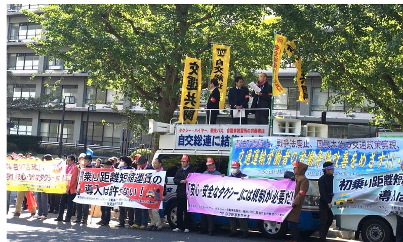
国土交通省前での要請行動

タクシー労働者が、安心・安全な公共交通を担うにふさわしい人並みの労働条件を勝ちとるために、あなたもぜひ自交総連へ加入してください。一緒にたたかきましょう。